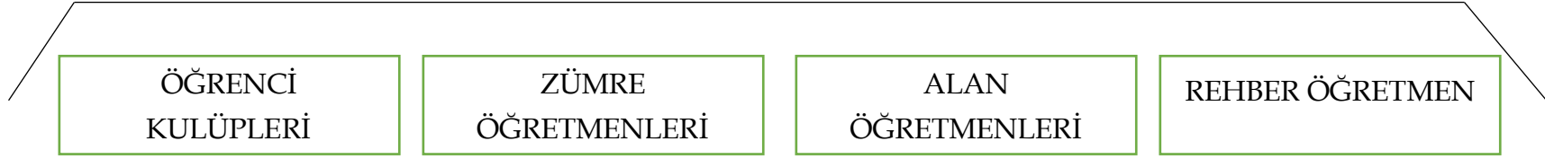
Şekil 1: Organizasyon Şeması